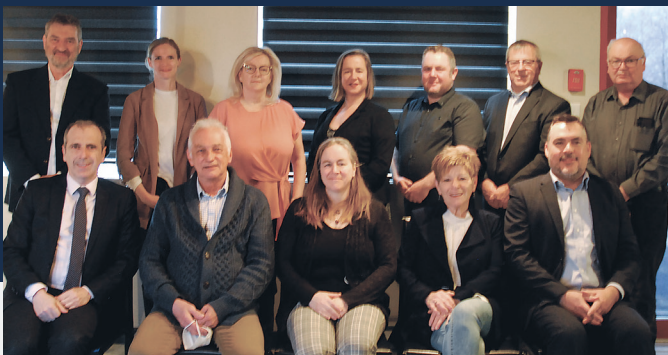
DES GENS ENGAGÉS ET REPRÉSENTATIFS DU MILIEU

DÉB offre le soutien technique et financier nécessaires afin d'aider les entrepreneurs à démarrer, à consolider et à développer leurs projets d'entreprises. DÉB a également le rôle d'animer le milieu et d'accompagner les communautés dans l'élaboration de leurs projets.